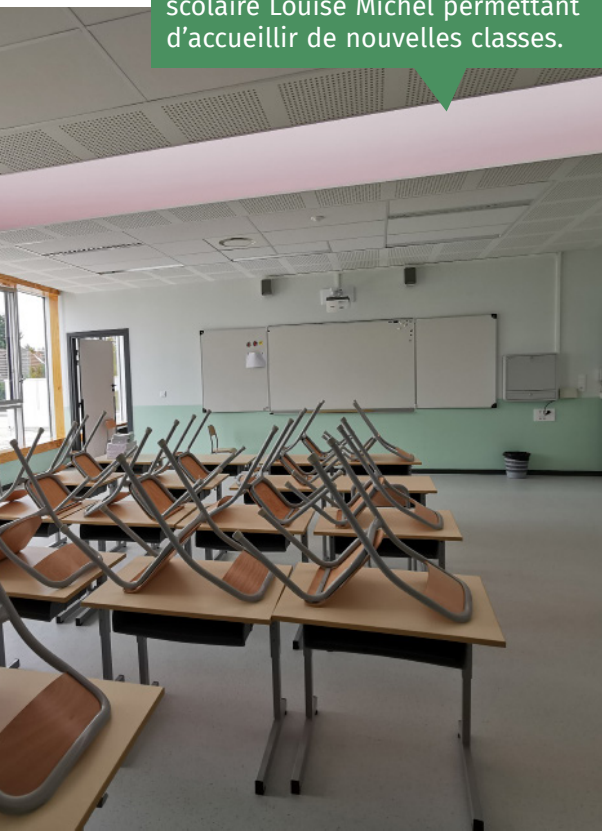
Livraison du 1 er étage du groupe scolaire Louise Michel permettant d'accueillir de nouvelles classes.