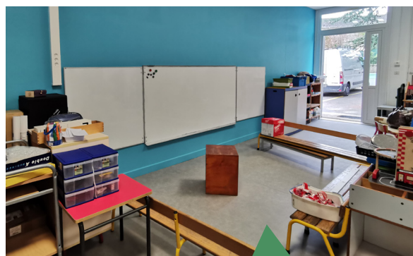
Réfection de deux classes et d'un couloir à l'école maternelle Pierre Curie.