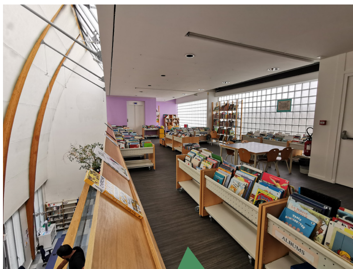
Rénovation du second étage (sol et peinture) de la Bibliothèque « Le Temps des cerises ».

D'autre part, les équipes techniques municipales ont conduit avec efficacité les travaux de maintenance et d'entretien des installations sportives et équipements municipaux. La mise en accessibilité des bâtiments s'est poursuivie conformément à l'agenda mis en place depuis plusieurs années. Les vestiaires de football ont été concernés cet été. L'autre volet des chantiers a porté sur la réfection et l'aménagement de voiries.