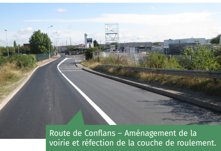
Route de Conflans – Aménagement de la voirie et réfection de la couche de roulement.