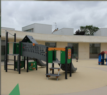
Installation d'aires de jeux dans le groupe scolaire Louise Michel.