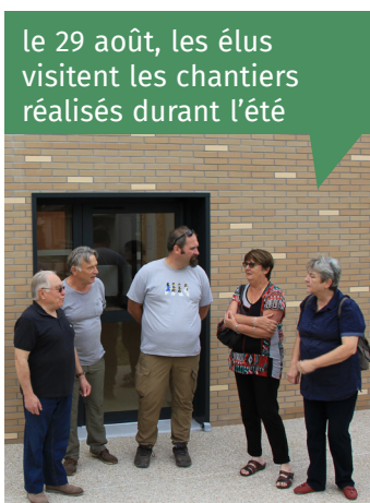
le 29 août, les élus visitent les chantiers réalisés durant l'été