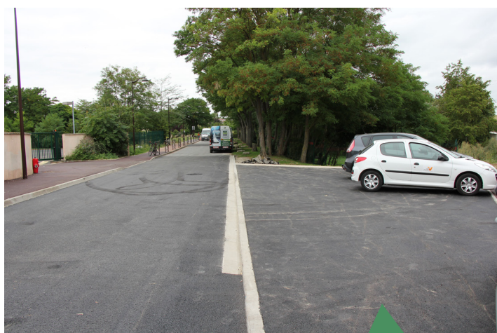
Aménagement de la placette rue Juliette Monnier (devant le collège du Petit Bois) avec création d'une zone de dépose minute, d'un passage piéton et d'un ralentisseur pour une meilleure sécurisation du site.