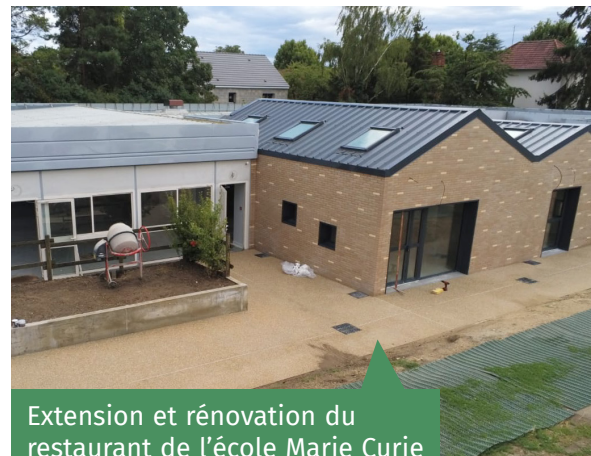
Extension et rénovation du restaurant de l'école Marie Curie avec passage en self.