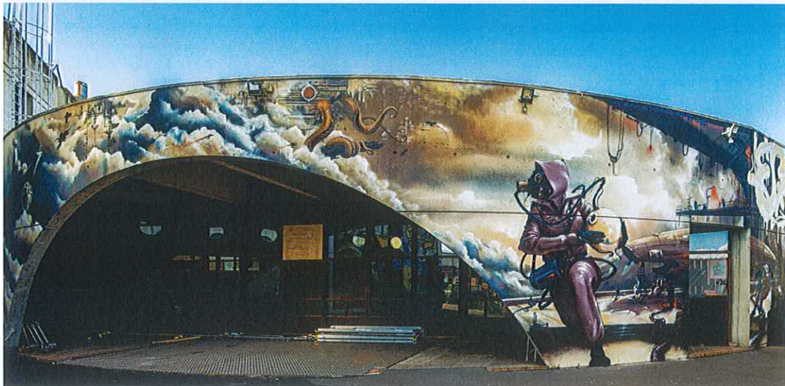
Fresque murale réalisée à l'occasion du festival Caps Attack 3 par le TSF Crew © Dominique Chauvin (2021)