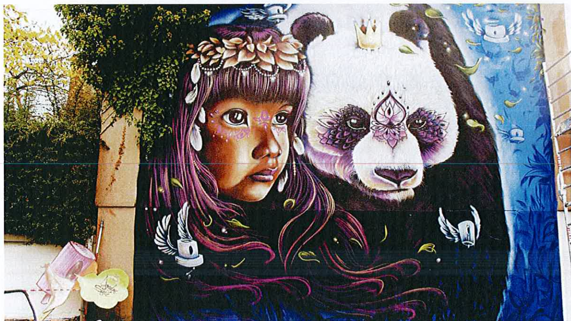
Fresque murale réalisée à l'occasion du festival Caps Attack 1 par l'artiste Doudou Style