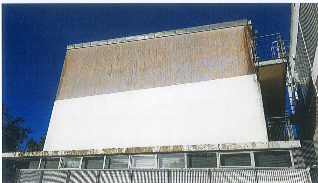
La façade du foyer-club © Christophe Haine (Octobre 2022)