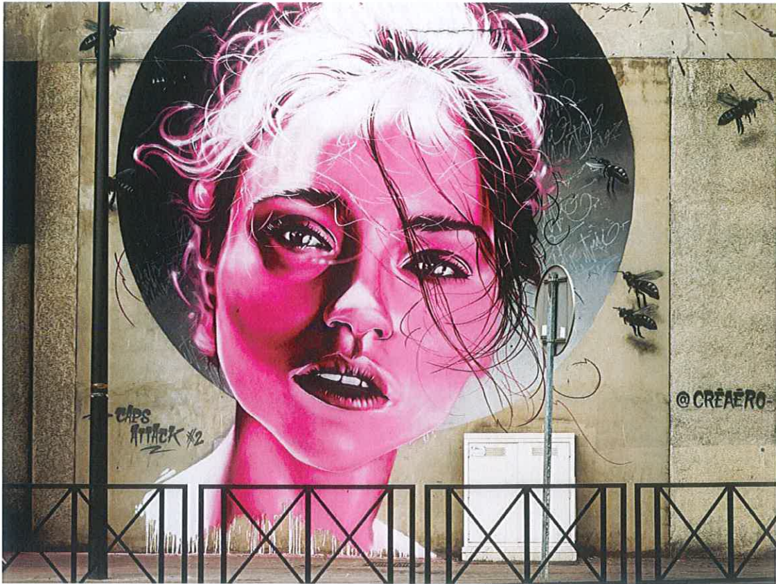
Queen Bee réalisée à l'occasion du festival Caps Attack 2 par l'artiste Aéro