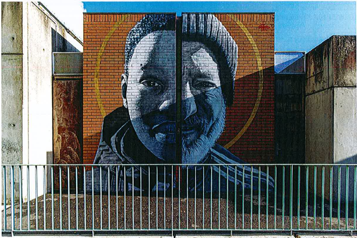
Fresque murale réalisée à l'occasion du festival Caps Attack 3 par l'artiste Swed © Dominique Chauvin (2021)