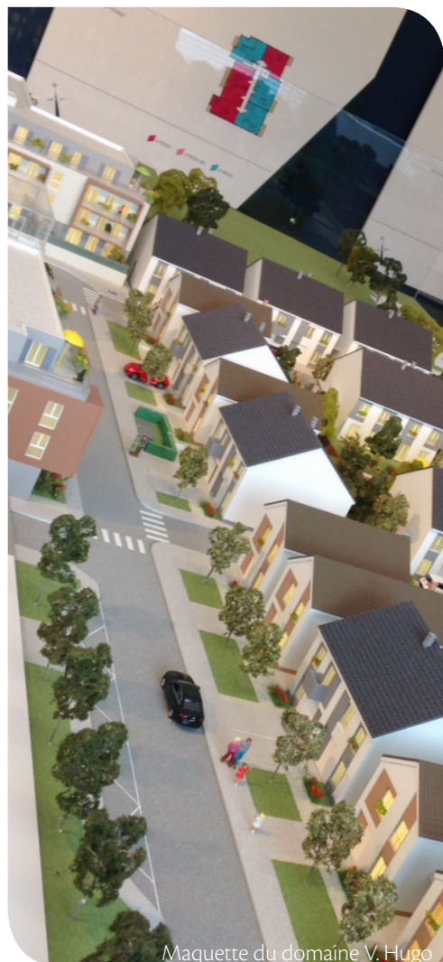
Maquette du domaine V. Hugo